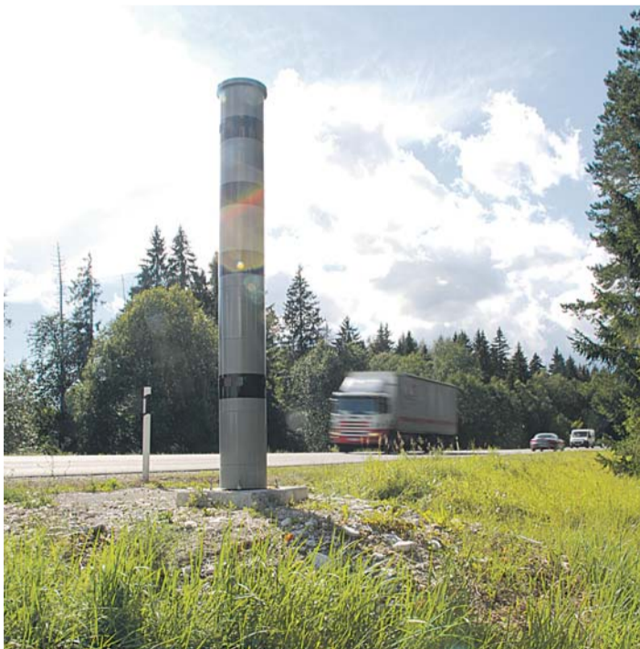
Juhtimisõiguse peatumise vältimiseks tuleb juhiluba õigeaegselt uuendada. Tuleval aastal ootab Eestis vahetamist koguni 80 000 juhiluba.