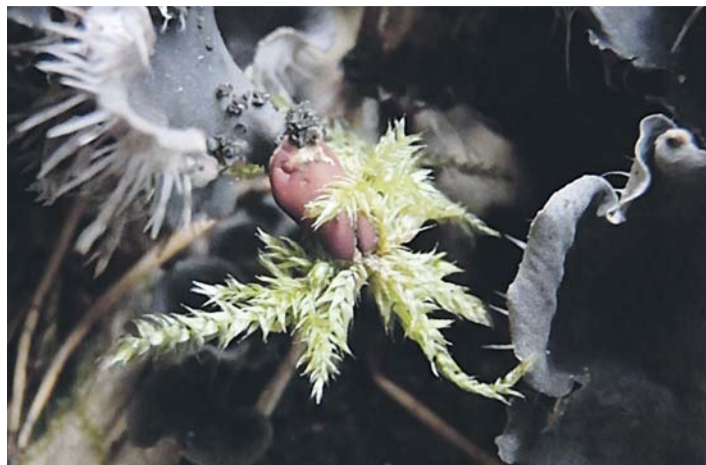
Pruunide silmadega ämblik.