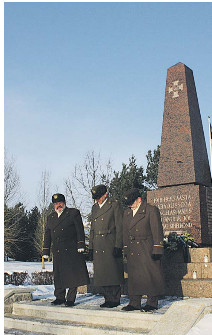
Eesti vabaduse eest langenute mälestuse austamine igal iseseisvuspäeval Jõelähtme vabadussamba jalamil.